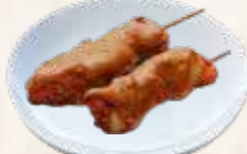
97 kip saté