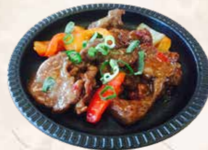
113 sichuan bief + €2,60