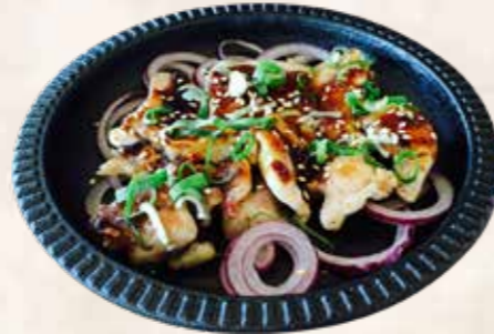
112 barbecue chicken + €2,60