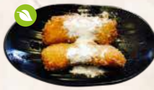
115 gebakken banaan