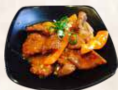
107 bief knoflook