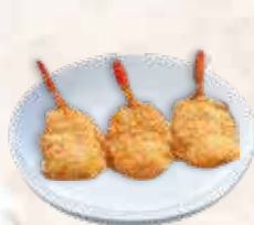
91 gepaneerde garnalen