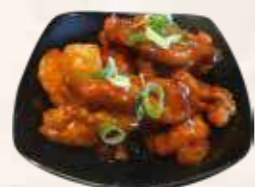
106 kip zoetzuur