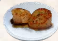
94 coquilles + €2,25