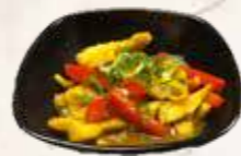
108 kip kerrie