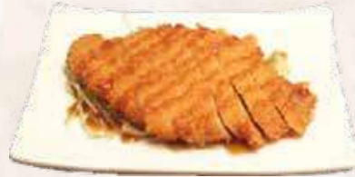
85 gepaneerde kip