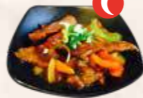
109 bief chili