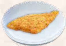
96 gebakken wijtingfilet