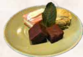
120 dessert 3 Brownie, groene thee ijs, tompouce