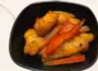
111 kip vijf kruiden