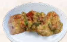
93 crème garnalen