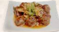
90 teppanyaki biefblokjes