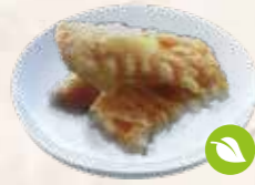
92 zoete aardappeltempura