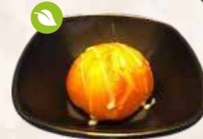
116 zoet broodje