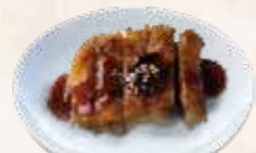
95 kip teriyaki